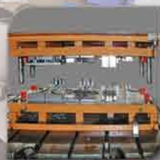
Tools to bend and stamp tubes Troqueles para doblar e conformar tubos