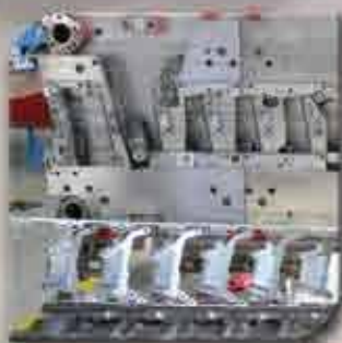
In-Die Piercing units for studs and nuts Unidades de clavazón de tornillos y tuercas