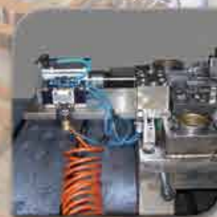
Pneumatic Devices to insert pins Sistemas neumáticos para inserción de pinos