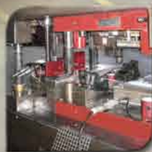
In-Die Tapping units Unidades de roscado

Nuestra misión consiste en mejorar continuamente nuestros productos y servicios para satisfacer las necesidades de nuestros clientes, permitiéndonos prosperar en Calidad, Precio y Plazo.